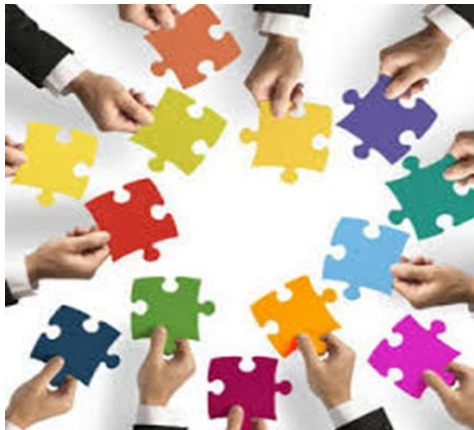
Ilustrativna slika : Timski rad